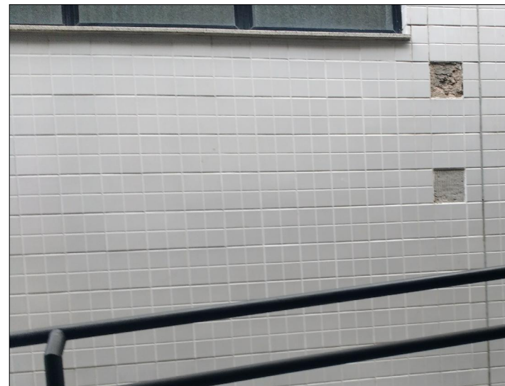
8 FOTO ÁREA C6