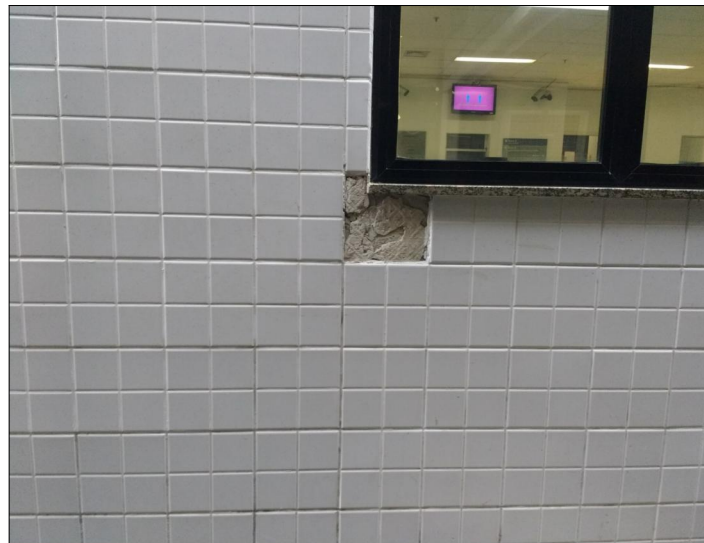
9 FOTO ÁREA C7