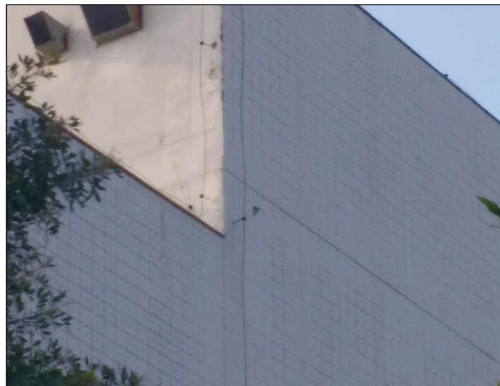
2 FOTO ÁREA A4