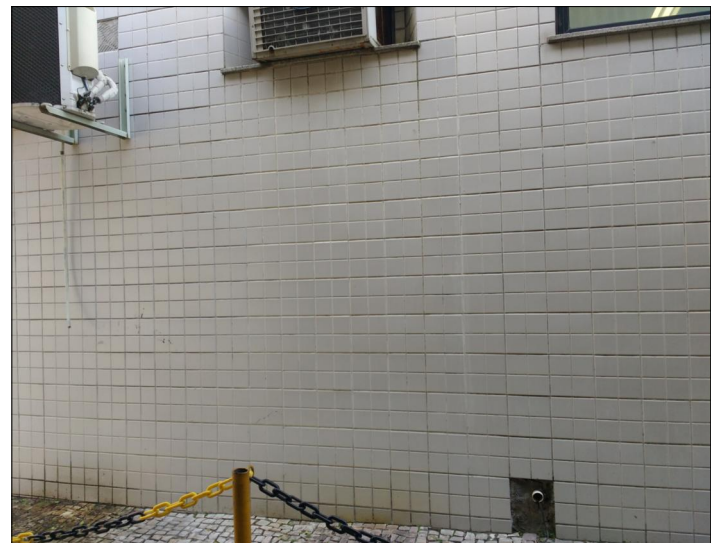
5 FOTO ÁREA C1