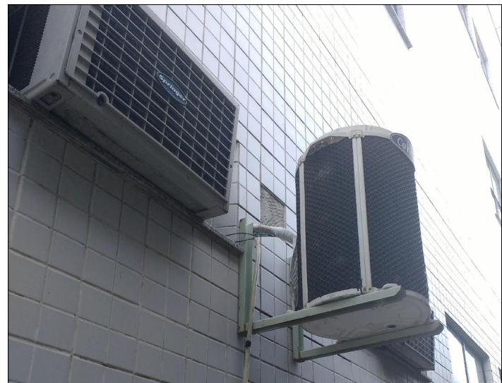
6 FOTO ÁREA C1