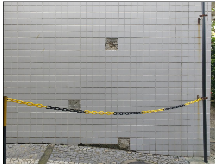
12 FOTO ÁREA C13