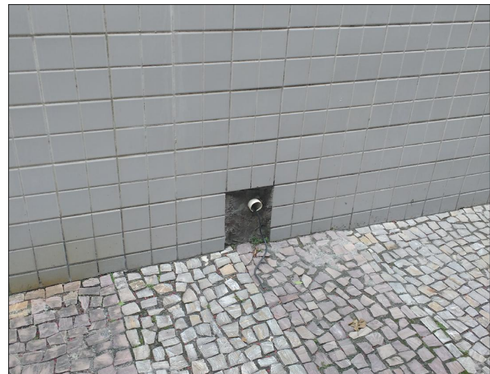
7 FOTO ÁREA C1