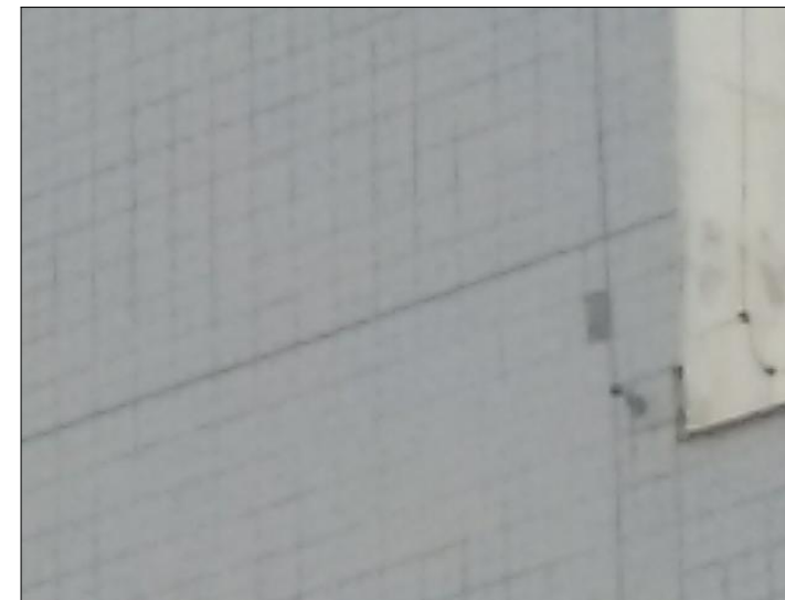
4 FOTO ÁREA A10