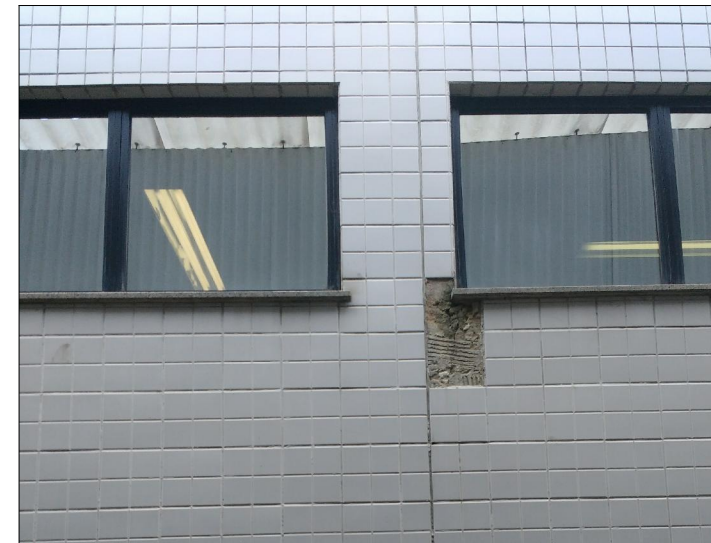
11 FOTO ÁREA C12